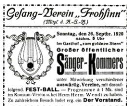
Anzeige in den Naunhofer Nachrichten

Mit ihm vereint werden noch einige auswärtige Brudervereine in der Sangeskunst wetteifern, worüber das in den bekannten Verkaufsstellen erhältliche Programm näheren Aufschluss gibt. Möge man dieser gesanglichen Veranstaltung allseitiges Interesse entgegenbringen, indem man hierbei alle Partei- und Klassenunterschiede außer acht lässt und nur der wahren Sangeskunst seine Aufmerksamkeit zuwendet. Ein darauffolgender Festball wird den Sänger-Kommers beschließen.