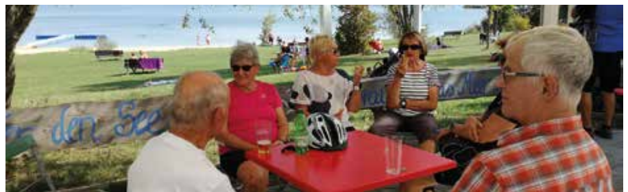
Pause am Großstolpener See

Auf kurzem Weg und ruhigen Kreisstraßen über Köhra, Belgershain, Oelzschau, Pötzschau und Espenhain erreichten die Fahrer den Ferienhain am Hainer See. Der Rundweg zur Lagune Kahnsdorf ist inzwischen durchweg asphaltiert und auch hier werden weitere Bauplätze erschlossen. Nach einer Pause am Lutherdenkmal in Neukieritzsch folgte im Kontrast zur prosperierenden Seenlandschaft am Hainer See der Blick vom Radweg an der B 176 in den lebenden Bergbau des Abbaufeldes Peres. Beide Blöcke des KW Lippendorf