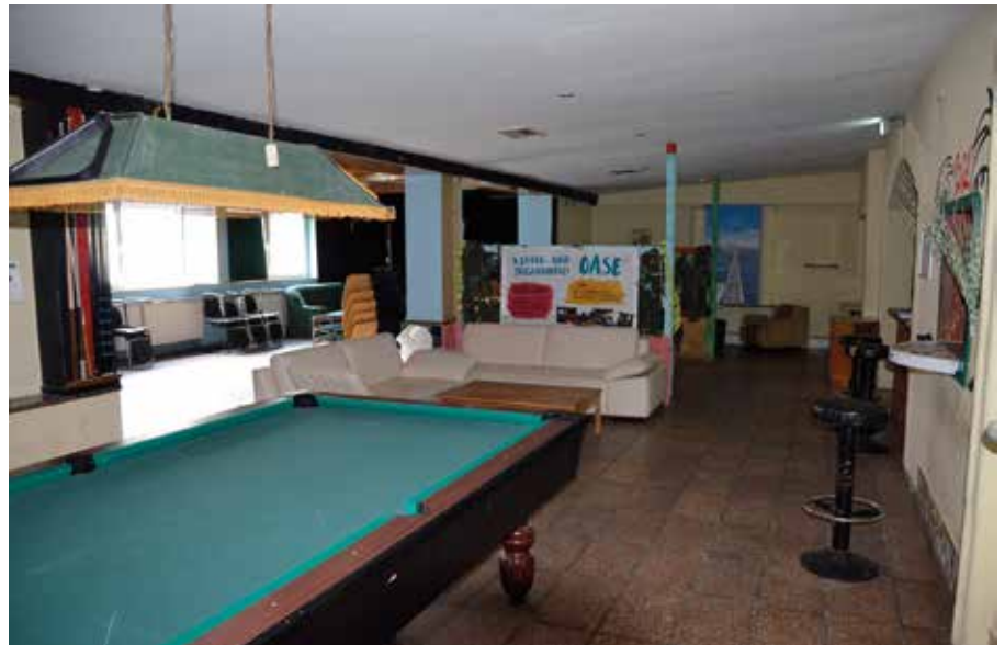
Bestandsaufnahme in der OASE

Durch regelmäßige „Talk“-Veranstaltungen sollen die Wünsche und Ideen