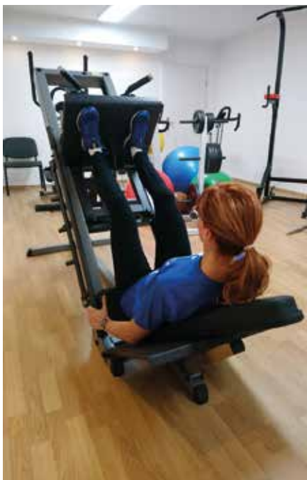
An der Beinpresse

Am Standort Mühlgasse des AktivSport SAXONIA in Naunhof finden derzeit Umbau- und Renovierungsarbeiten des Fitnessgeräte Raumes statt. Daneben werden Wandspiegel zum Beobachten und Korrektur der eigenen Übungsausführungen angebracht. Damit ist eine effizientere Verbesserung der Übungen und eine bessere Körperwahrnehmung möglich. Anmeldungen sind persönlich oder telefonisch über das Vereinsbüro möglich.