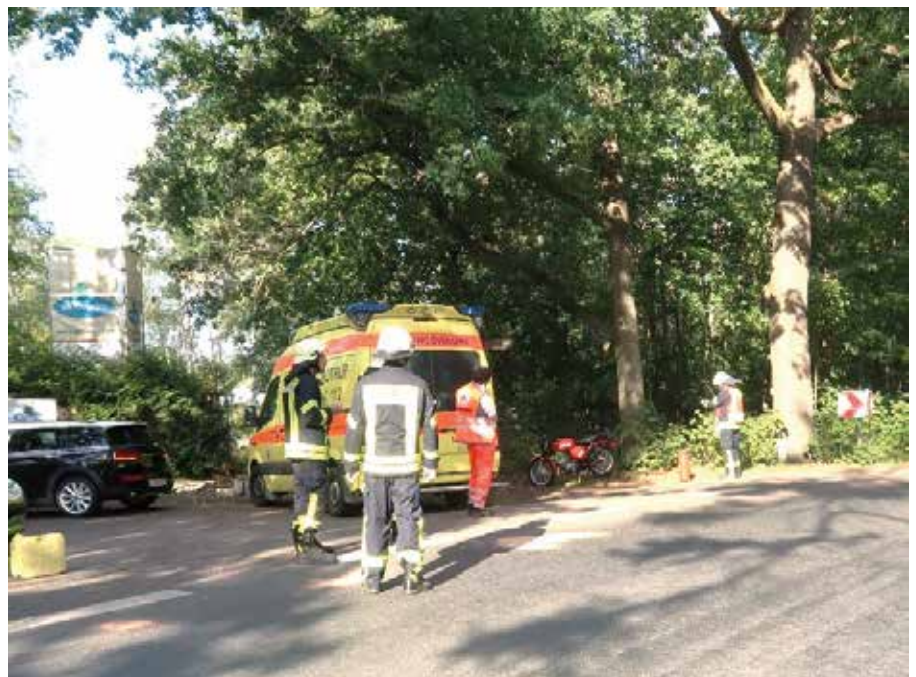
Verkehrsunfall zwischen Naunhof und Ammelshain am 10. September

Hilfeleistung ausrücken müssen. Das alles geschieht innerhalb weniger Minuten und es bleibt fast keine Zeit sich auf die bevorstehende Situation einstellen zu können. Zum Glück gingen die Einsätze in den vergangenen Wochen immer glimpflich aus bzw. waren nur kleinere Verletzungen oder Sachschaden zu beklagen. So kam es am 10. September zu einem Verkehrsunfall zwischen einem Moped und einem PKW auf der Straße zwischen Naunhof und Ammelshain. Auf der Wiese an der Reha-Klinik in Erdmannshain brannte am 20. September ein Baum. In Albrechtshain wurde am 1. Oktober ein Reh aus einem Swimmingpool gerettet. Ein weiterer Unfall ereignete sich einen Tag später in der Naunhofer Bahnhofstraße. Hier stürzte ein Motorradfahrer, zum Glück ohne schwere Folgen für ihn. Die Feuerwehr sorgte neben der Absicherung der Unfallstelle und Erstversorgung dafür, auslaufende Betriebsstoffe zu binden. Am 9. Oktober wurden die Kameraden zu einem Gartenlaubenbrand nach Albrechtshain gerufen. Beim Löschen hier half auch die Beuchaer Feuerwehr mit. Weitere Alarmierungen betrafen einen Einsatz am See mit zwei Personen im Wasser, was sich jedoch nicht bestätigte, ausgelaufene Betriebsstoffe in Albrechtshain sowie Fehlalarmierungen, verursacht durch Brandmeldeanlagen.