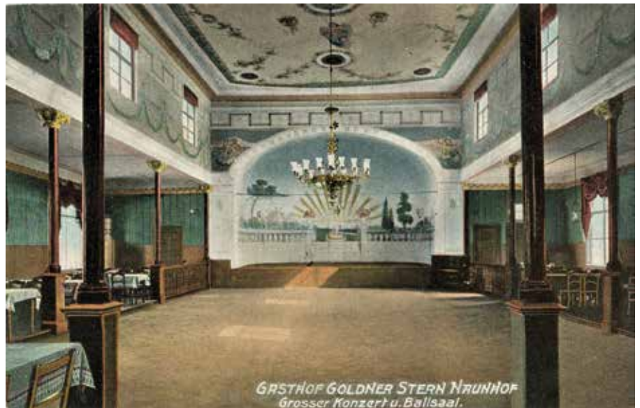
Großer Konzert- und Ballsaal des Gasthofs Goldener Stern

Am Sonntag fand im Gasthof „zum goldenen Stern“ seit Kriegsende hierorts der 1. Sänger- Kommers statt, veranstaltet vom Arbeiter-Gesang-Verein „Frohsinn“. Mehrere Vereine waren von